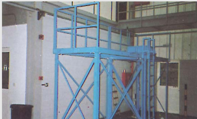
غربال آلي لتنقية المواد المحببة Screening Machine for Screening of Granulated Materials