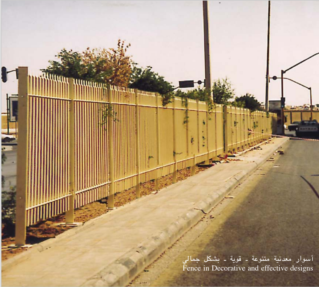
أسوار معدنية متنوعة - قوية - بشكل جمالي Fence in Decorative and effective designs

The Factory manufactures all kinds of metal works. It can satisfy the many different needs of the customers, and solve their problems in metal constructions for industrial and agricultural applications. It has facilities to produce spare parts as well.