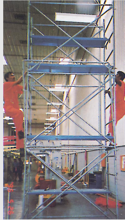
سقالات معدنية سهلة الفك والتركيب آمنة الإستعمال Scaffolding Towers