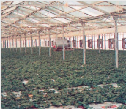
كفاءة تشغيل عالية High Efficiency