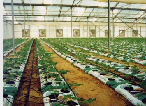
تحكم فائق الدقة High Control

المصنع: الرياض - المدينة الصناعية الثانية - ص.ب ٦٢٨٨٧ الرياض ١١٥٩٥ - هاتف : ٤٩٨١٠٩٠ - فاكس : ٤٩٨٤٣٣٦ المركز الرئيسي : مبنى نافا - ٥٣٦ شارع التخصصي - ص.ب ٢٣٠٠٩٩ الرياض ١١٣٢١ - المملكة العربية السعودية - تلفون ٤٧٠٨٨٨٨ - فاكس ٤٧٠٨٨٥٥ أو الرقم المجاني ٨٠٠١٢٤٦٢٣٢ (هاتف / فاكس) الفروع: الرياض - جدة - الدمام - أبها - الجوف - القصيم - الخرج - حائل - تبوك - نجران - واشنطن - لندن - القاهرة - بغداد - الخرطوم Factory : Riyadh - 2nd Industrial City - P.O.Box 62887 Riyadh 11595 - Tel.: 4981090 - Fax: 4984336 Head Office: NAFA Building - 536 Takhassosy St., P. O. Box 230099 Riyadh 11321, Kingdom of Saudi Arabia, Tel.: 4708888, Fax: 4708855 Branches: Riyadh, Jeddah, Dammam, Abha, Al-Jouf, Al-Qassim, Al-Kharj, Hail, Tabuk, Najran, Washington, London, Cairo, Baghdad, Khartoum Dial toll free: 800-124-6232 (Tel. / Fax) E-Mail: mwf@nafa.net Web site: www.nafa.net