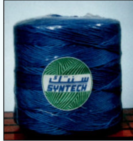
خيوط مبرومة TWINES

المصنع: المدينة الصناعية: المرحلة الخامسة - ص.ب ٣٣٠٤٢ جدة ٢١٤٤٨ - تلفون ٦٣٥١٧٣١ - فاكس ٦٣٨٠٨٦٦ Factory: Industrial City, Phase 5, P.O.Box 33042 Jeddah 21448, Tel. 6351731, Fax 6380866 المركز الرئيسي: مبنى نافا - ٥٤٢ شارع التخصصي - ص.ب ٢٣٠٠٩٩ الرياض ١١٣٢١ - المملكة العربية السعودية - تلفون ٤٧٠٨٣٦٦ فاكس ٤٧٠٨٨٥٥ الفروع: الرياض - جدة - الدمام - أبها - الجوف - القصيم - الخرج - حائل - تبوك - نجران - واشنطن - لندن - القاهرة - بغداد - الخرطوم Head Office: NAFA Building - 542 Takhassosy St., P.O.Box 230099 Riyadh 11321, Kingdom of Saudi Arabia, Tel.: 4708366, Fax: 4708855 Branches: Riyadh, Jeddah, Dammam, Abha, Al-Jouf, Al-Qassim, Al-Kharj, Hail, Tabuk, Najran, Washington, London, Cairo, Baghdad, Khartoum Dial toll free : 800-124-6232 E-Mail: syntech@nafa.net Web Site: www.nafa.net