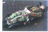
كراسي قابلة للتحويل الى إسعاف