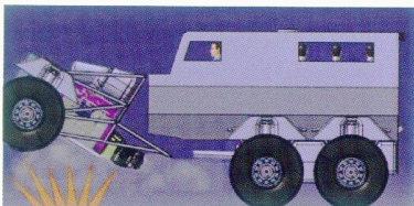
إنفصال القسم الأمامي عند التعرض لإنفجار