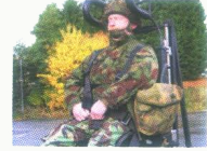
الجندي جالس بكافة المعدات